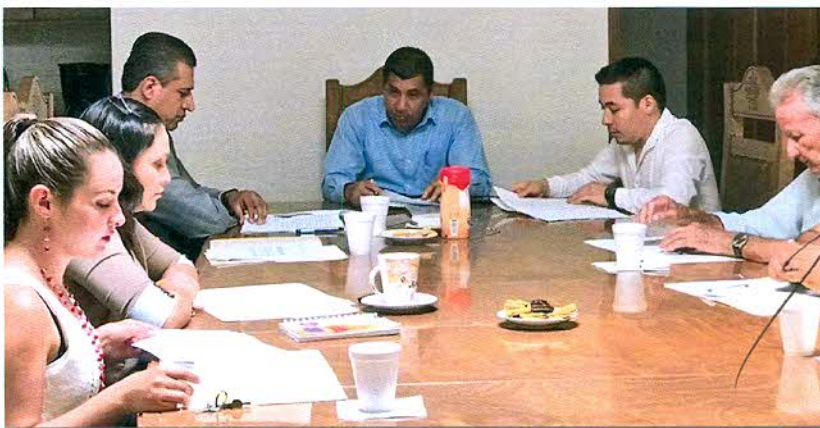
Tercera sesión de COPLADEMUN del municipio de Zacazonapan en seguimiento a su primera evaluación a su plan de desarrollo