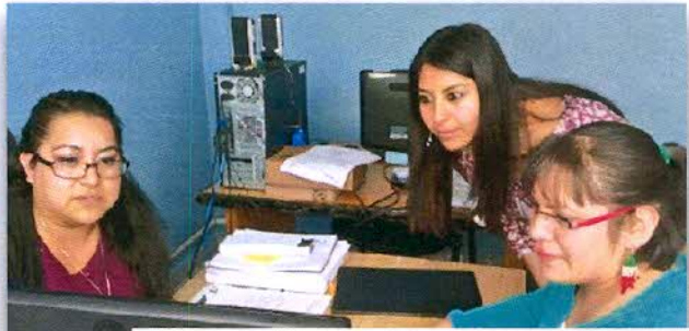
Capacitación para la 1a Evaluación del Plan de Desarrollo Municipal a los servidores públicos de Temoaya