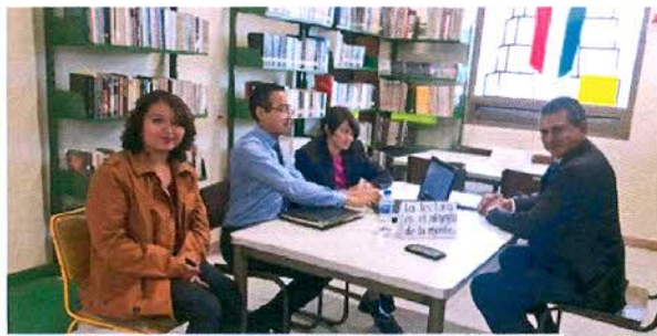
Capacitación para la 1a Evaluación del Plan de Desarrollo Municipal a los servidores públicos de Ozumba