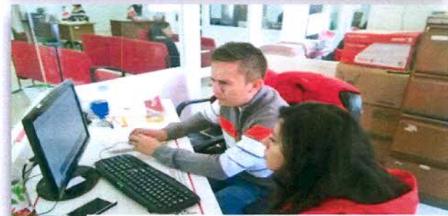
Capacitación para la 1a Evaluación del Plan de Desarrollo Municipal a los servidores públicos de San Mateo Atenco

De los 125 municipios, se invitó a titulares e integrantes de las UIPPEs, asistiendo un total de 112 representantes y posteriormente, se proporcionó el mismo ejercicio a los 13 restantes.