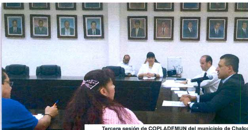
Tercera sesión de COPLADEMUN del municipio de Chalco en seguimiento a su primera evaluación a su plan de desarrollo

Artículos 19, fracción I, 20 fracción VIII de la Ley de Planeación del Estado de México y Municipios