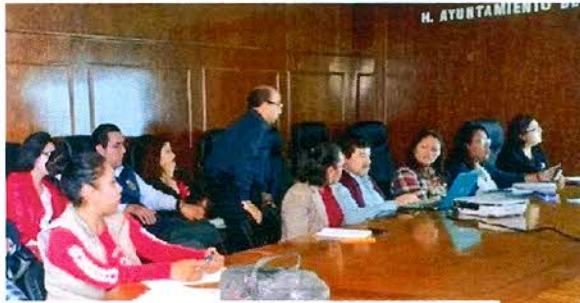
Capacitación para la 1a Evaluación del Plan de Desarrollo Municipal a los servidores públicos de Jaltenco

El COPLADEM diseñó y organizó el Taller para la Evaluación Semestral del Plan de Desarrollo Municipal 2016-2018.